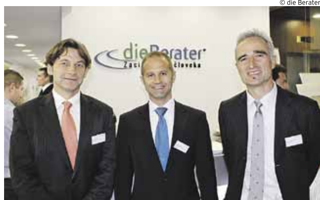
Das neue „die Berater“-Schulungszentrum in Bratislava

Schritt in die Slowakei gewagt haben, „Von diesem Standort aus können wir sowohl bereits in der Slowakei ansässige, internationale Konzerne als auch heimische Unternehmen beraten, die selbst den Schritt Richtung Osteuropa gehen.“ Geboten werden im neuen Schulungszentrum umfassende Weiterbildungsmöglichkeiten, angefangen von IT-Kursen über Sprachtraining, Soft Skills und Führungskräftetrainings bis hin zu Wirtschaftskursen und internationalen Zertifikaten (zB. ECDL, EBC*L, usw).