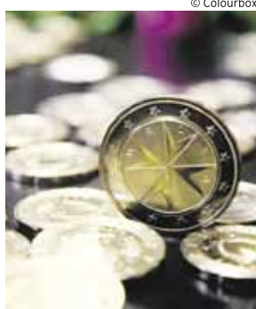
Weiterbildungsgeld wird vom AMS überwiesen

bewährt. Diese Maßnahme, die im Pakt für Arbeit und Qualifizierung 2010 abgewickelt wird, gibt es in allen Bundesländern.