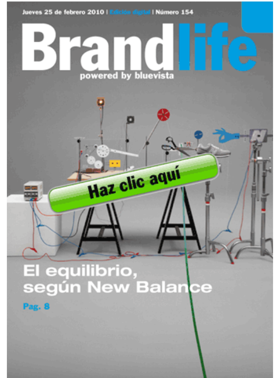
Ojea nuestra revista digital

Para los que no puedan estar delante de una pantalla de ordenador esta noche, la ponencia estará disponible bajo demanda en el blog de Flumotion.