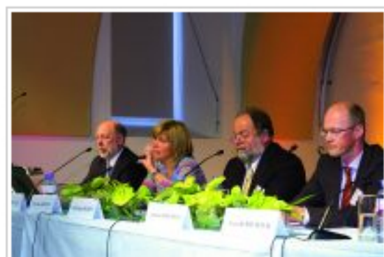
Logistik-Joblounge war voller Erfolg