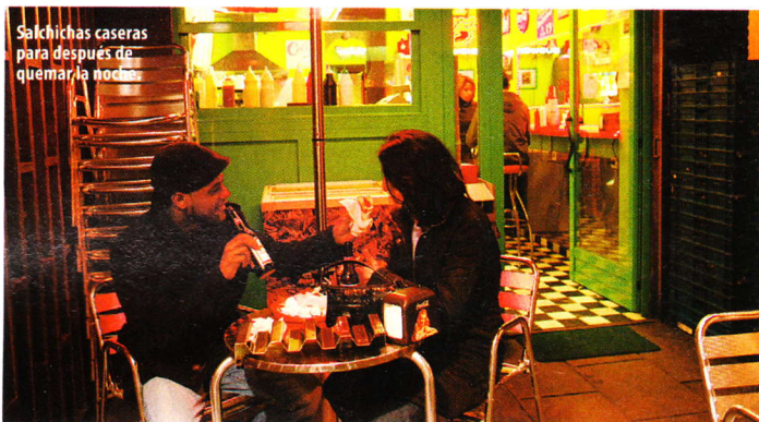
Salchichas caseras para después de quemar la noche.