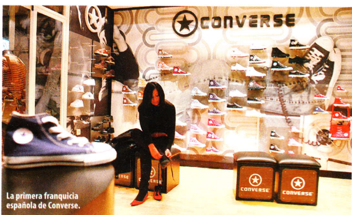
La primera franquicia española de Converse.

cional, rock'n'roll cincuentón como banda sonora, terraza durante todo el año y un horario hiperextendido (los fines de semana abren a las 6 de la mañana, coincidiendo con el cierre de las discotecas y las colas son dignas de un after) completan una oferta pequeña pero matona y muy muy yanqui. Hortaleza, 10 (Madrid). Abierto todos los días de 12 a 2 h. Viernes y sábados desde las 6 h. T. 91 524 93 63.