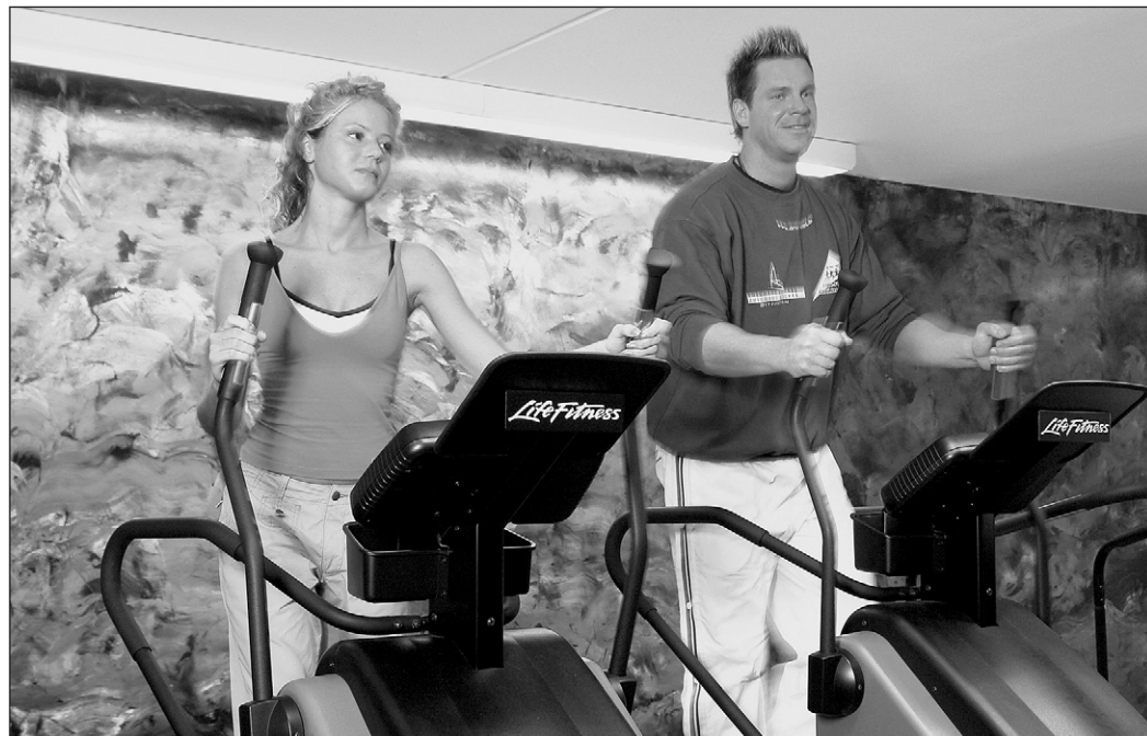
Auch die Fitness-Klub-Mitgliedschaft könnte mündlich gekündigt werden.

Peter Kolba ist Leiter des Bereiches Recht im Verein für Konsumentinformation (VKI).