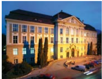
Die Leobener Uni ergatterte 86.000 € an Fördergeldern von aws.

Leoben. Forscher der Montanuniversität Leoben haben für den Prototyp-Bau eines neuen Erdöl-Fördereinrichtungssystems 86.000 € beim Wettbewerb „Prize 2009“ des Austria Wirtschaftsservice gewonnen. Mit der Unterstützung für das mit 270.000 € veranschlagte Projekt wird ab Jänner 2010 die Entwicklung des Prototyps in Angriff genommen, so die Uni.