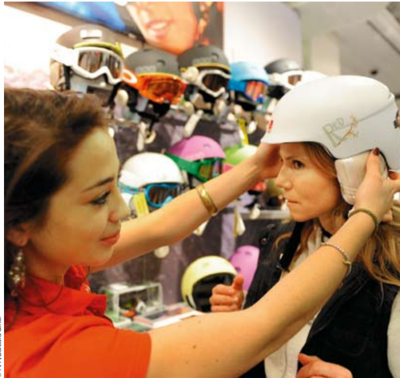
Vor allem im Handel gibt es noch Potenzial für die Arbeitskräfteüberlasser.

Diese Umfrage besagt, dass 38% der 240 befragten Mitarbeiter „sehr zufrieden“, knapp 59% „zufrieden“ sind. Dass Arbeiter oder Angestellte bei dem Beschäftigungsbetrieb