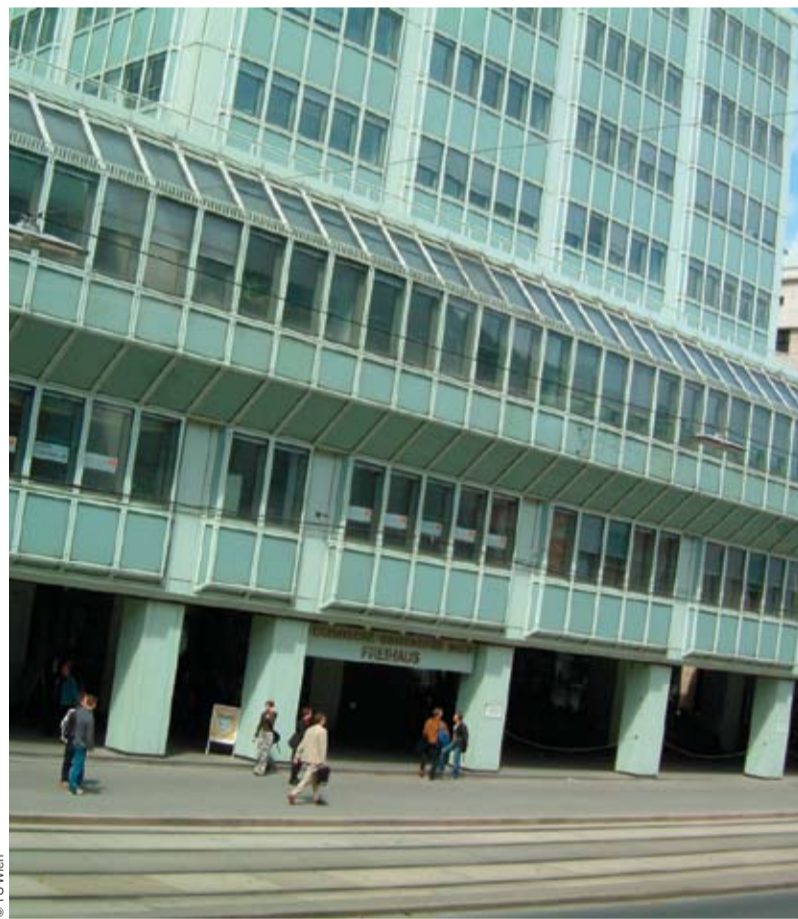
Elf Projekte an der TU Wien werden mit einer Finanzspritze bedacht.

Wien. Die Technische Universität (TU) Wien investiert mit dem erstmals ausgeschriebenen TU-internen Personalförderprogramm „Innovative Ideen“ in den kommenden drei Jahren etwa 1,5 Mio. € in elf von internationalen Peers begutachtete Projekte.