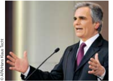
Kanzler Faymann will 100.000 Personen am Arbeitsmarkt helfen.

Wien. Angesichts steigender Arbeitslosenzahlen soll der heimische Arbeitsmarkt mit einer Qualifizierungsoffensive entlastet werden. Bundeskanzler Werner Faymann hat nun seine Pläne konkretisiert, wie er rund 100.000 Personen dabei unterstützen will, im kommenden Jahr Arbeit zu finden. Dies bedeute aber nicht, dass es 100.000 zusätzliche Jobs geben werde, wurde im Büro Faymann betont. Die für die Unterstützungsmaßnahme erforderlichen 70 Mio. € kommen aus dem Sozialministerium. Wirtschaftsminister Mitterlehner hat die Kanzlerinitiative begrüßt, aber daran erinnert, dass nur Wirtschaftswachstum Job schaffe. Außerdem wurde betont, dass bei den Maßnahmen keine zusätzlichen Budgetmittel erforderlich seien, was der Wirtschaftsminister immer abgelehnt hatte. Laut Faymann soll das dritte Arbeitsmarktpaket, das es laut ÖVP unter diesem Namen gar nicht gibt, vor allem Frauen zugutekommen. (APA)