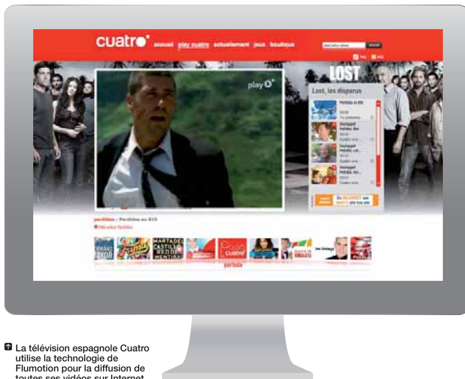
La télévision espagnole Cuatro utilise la technologie de Flumotion pour la diffusion de toutes ses vidéos sur Internet.

Monter sa propre solution WebTV est tout à fait réalisable. Il faut simplement comprendre que cela demande du temps, de l'énergie, de la mobilisation et