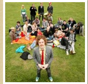
We're From Barcelona (nice band)