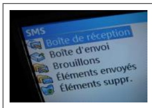
agrandir la photo

Le modèle économique est lié au chiffre d'affaires et au volume de transactions réalisé. Le site sera, quant à lui, facturé sur une base fixe à laquelle s'ajoutera une commission, à l'image des modes de paiement comme Paypal.