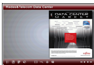
Data Center Market 2