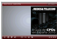
Guía de CPDs en España 2010