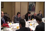
Comunicación empresarial en tiempo real